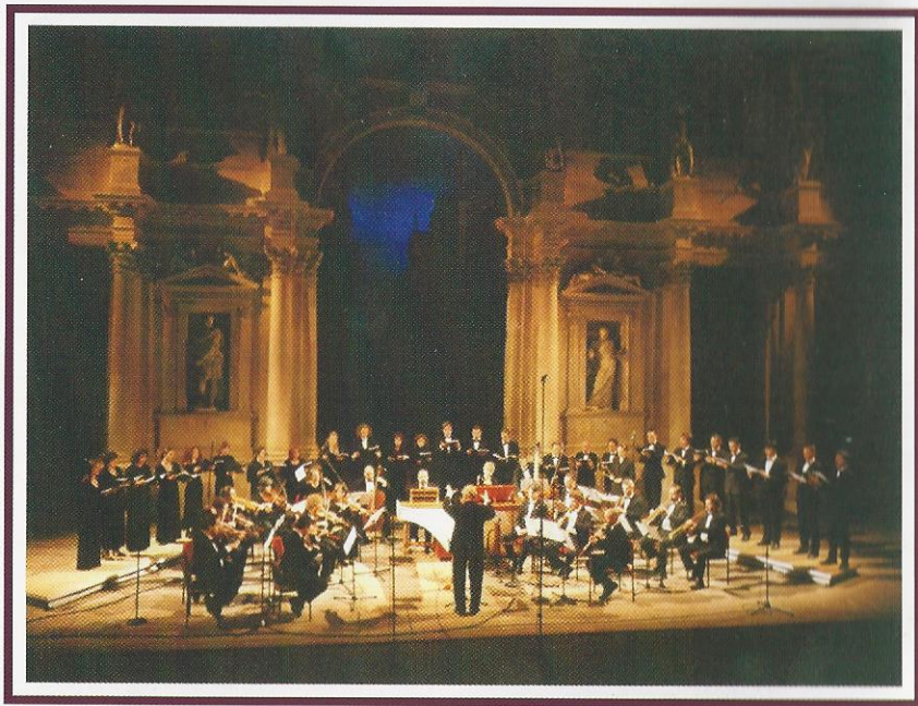
Concerto nel Teatro Olimpico di Vicenza