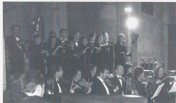
"Pavia, Basilica di S. Lanfranco"