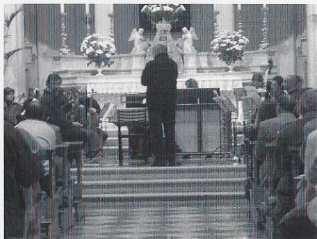
Particolari della prova generale, Chiesa di San Filippo Neri - Vicenza