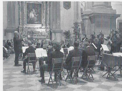
"Verona, Chiesa di S. Tommaso Cantuariense"