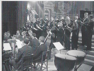
"Treviso, Tempio di S. Nicolò"

FONDAZIONE CASSA DI RISPARMIO DI VERONA VICENZA BELLUNO ANCONA